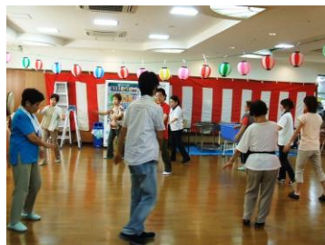
夏まつり前日の練習風景

今年で5回目の夏祭りでしたが、家族様の参加も多く利用者様と一緒に楽しく過ごしていただけたのではないかと思います。私が一番に心に残っているのは、盆踊りです。利用者様は始め見学をしていましたが、職員やボランティアの方と一緒に輪の中に入り楽しそうに踊っていたのが心に残っています。また、地域のボランティアの方には、準備や盆踊りの練習から当日のお手伝いまで、いつも色々な行事に携わって頂き、本当に感謝の言葉でいっぱいです。本当にいつもご協力ありがとうございます。ごとうござい