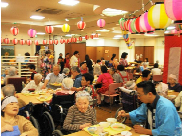
皆さんで いただきま〜す！！

第一部の屋台は、『お好み焼き』『焼そば』といった定番のものから、昨年行列の出来た『ソフトクリーム』を『かき氷』に替えたりと、新たな試みも試してみました。今年始めての挑戦は、『ベビーカーステラ』で