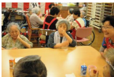
利用者のみなさんとの談笑