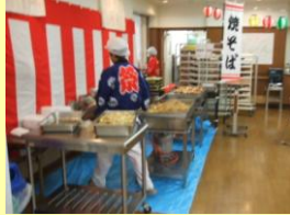
アツアツはいかが?