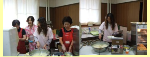
初挑戦のワッフルで～す

踊りの指導を頂いたあきね会の皆さんに混ざって、利用者の皆さんも飛び入り参加でえとでもにぎわいました。