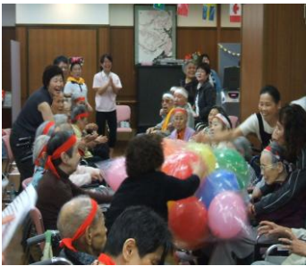
白熱する風船リレー