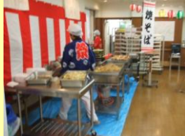
アツアツはいかが?